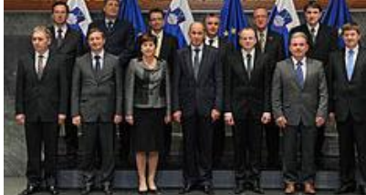
10. vlada Republike Slovenije predsednik vlade: Janez Janša (SDS)