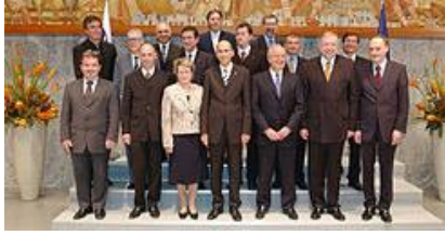
8. vlada Republike Slovenije predsednik vlade: Janez Janša (SDS)