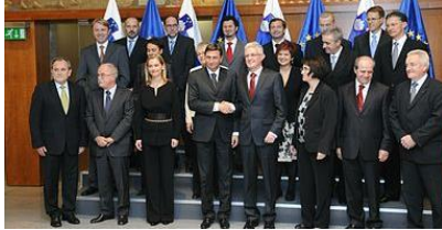
9. vlada Republike Slovenije predsednik vlade: Borut Pahor (SD)