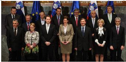
11. vlada Republike Slovenije presednica vlade; Alenka Bratušek (PS, zdaj ZAB)